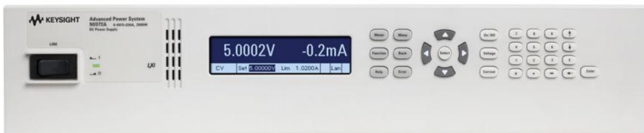
Рисунок 4 – Общий вид источников питания N6970A (размер 2U)