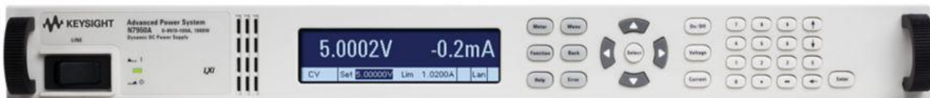
Рисунок 2 – Общий вид источников питания N7950A (размер 1U)