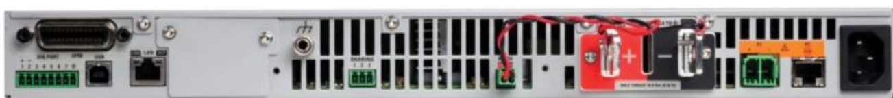
Рисунок 3 – Тыльная сторона источников питания серий N6900, N7900 (размер 1U)