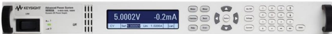
Рисунок 1 – Общий вид источников питания N6950A (размер 1U)