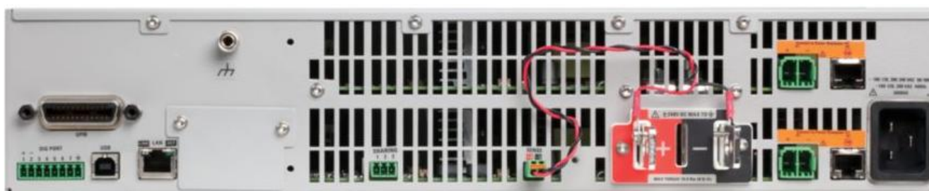
Рисунок 6 – Тыльная сторона источников питания серий N6900, N7900 (размер 2U)