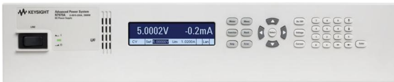
Рисунок 5 – Общий вид источников питания N7970A (размер 2U)