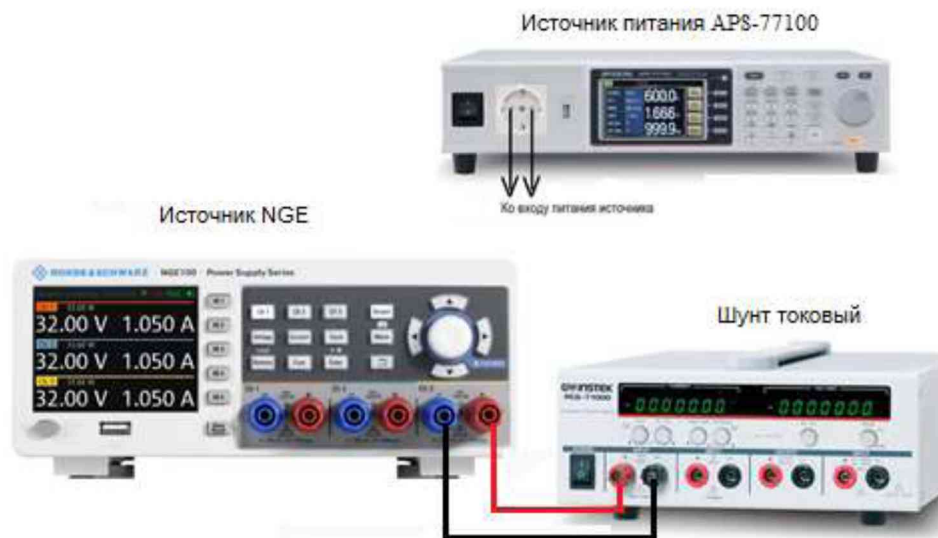
Рисунок 4 – Структурная схема соединения приборов для измерения параметров выходного тока источника

7.8.3 Подключение поверяемого источника к шунту PCS-71000 производить согласно руководству по эксплуатации и в соответствии с рисунком 4. Выбор предела измерения на шунте осуществлять исходя из максимального значения силы тока на выходе источника. Предел измерения силы тока шунта должен быть больше установленного значения силы тока на источнике.