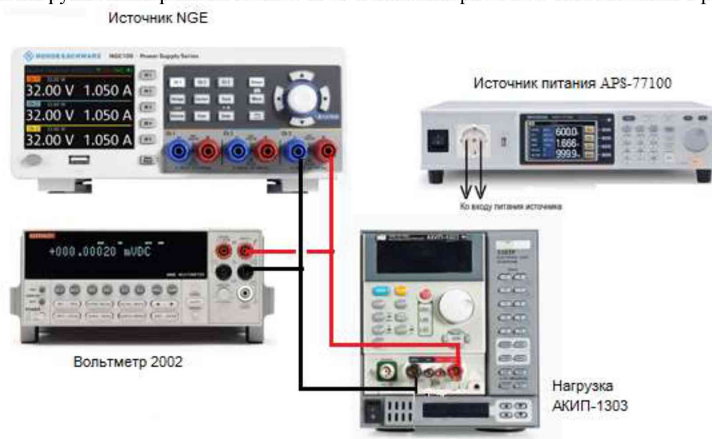
Рисунок 2 – Структурная схема соединения приборов для определения нестабильности выходного напряжения источников

7.5.1 Подключить вход сетевого питания поверяемого источника ко выходу источника питания APS-77100. На источнике питания APS-77100 установить напряжение, равное номинальному (230 В), контролируя его при помощи встроенного вольтметра. Разъемы поверяемого источника соединить при помощи измерительных проводов с соответствующими разъемами нагрузки электронной АКИП-1303 и вольтметра 2002 в соответствии с рисунком 2.