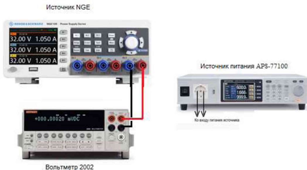
Рисунок 1 – Структурная схема соединения приборов для определения параметров выходного напряжения источников

7.4.1 Собрать измерительную схему, представленную на рисунке 1. Подключить вход сетевого питания поверяемого источника ко выходу источника питания APS-77100. На источнике питания APS-77100 установить напряжение, равное номинальному (230 В), контролируя его при помощи встроенного вольтметра. Мультиметр цифровой 2002 (далее вольтметр 2002) подключить к выходу поверяемого источника.