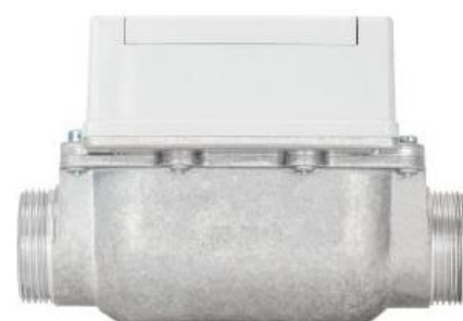
Рисунок 1 – Общий вид счетчиков газа микротермальных СМТ в исполнениях СМТ-А, СМТ-Смарт, СМТ-Смарт-К