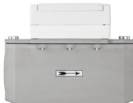
Рисунок 2 – Общий вид счетчиков газа микротермальных СМТ в исполнениях СМТ-Комплекс, СМТ-Комплекс-К, СМТ-Комплекс-ДКЗ