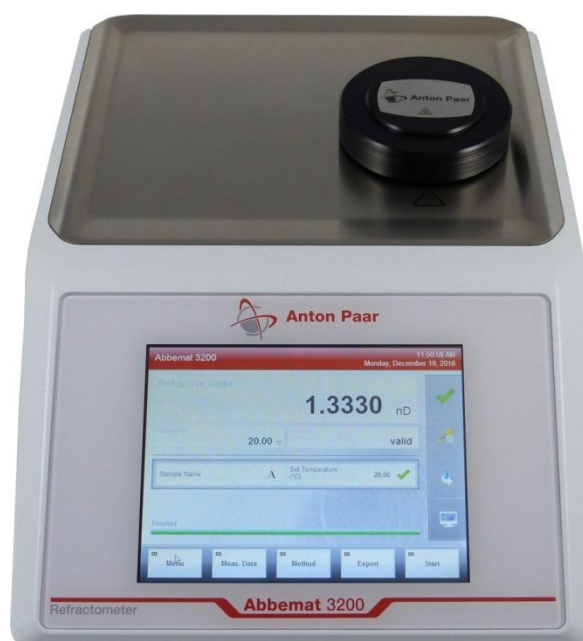
Рисунок 3 - Общий вид рефрактометров автоматических цифровых Abbemat 3000, Abbemat 3100 и Abbemat 3200