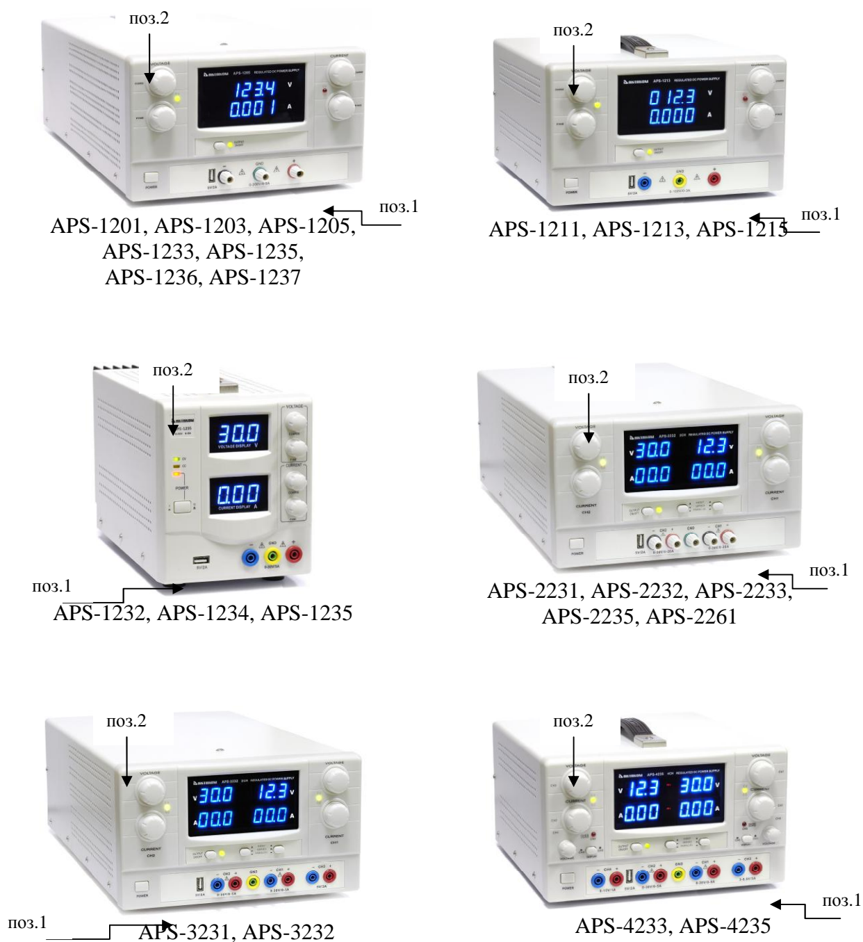
Рисунок 1 - Общий вид источников питания.