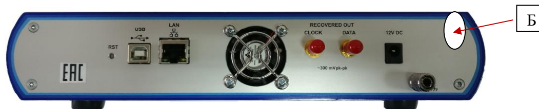
Рисунок 2 – Вид задней панели осциллографов и схема пломбировки от несанкционированного доступа (Б)