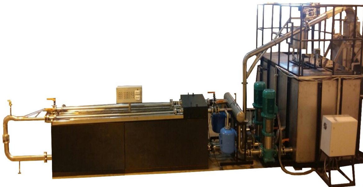
Рисунок 2 – Общий вид установок поверочных ТЕСТ-РС

Пломбировка установок поверочных ТЕСТ-РС осуществляется с помощью свинцовой (пластмассовой) пломбы и проволоки, которой пломбируются фланцевые соединения расходомеров установки, с нанесением знака поверки на пломбу. Средства измерений условий окружающей и измеряемой среды пломбируются в соответствии с описанием типа на конкретное средство измерений. Места нанесения знака поверки на фланцевые соединения расходомеров установок поверочных ТЕСТ-РС приведены на рисунке 3.