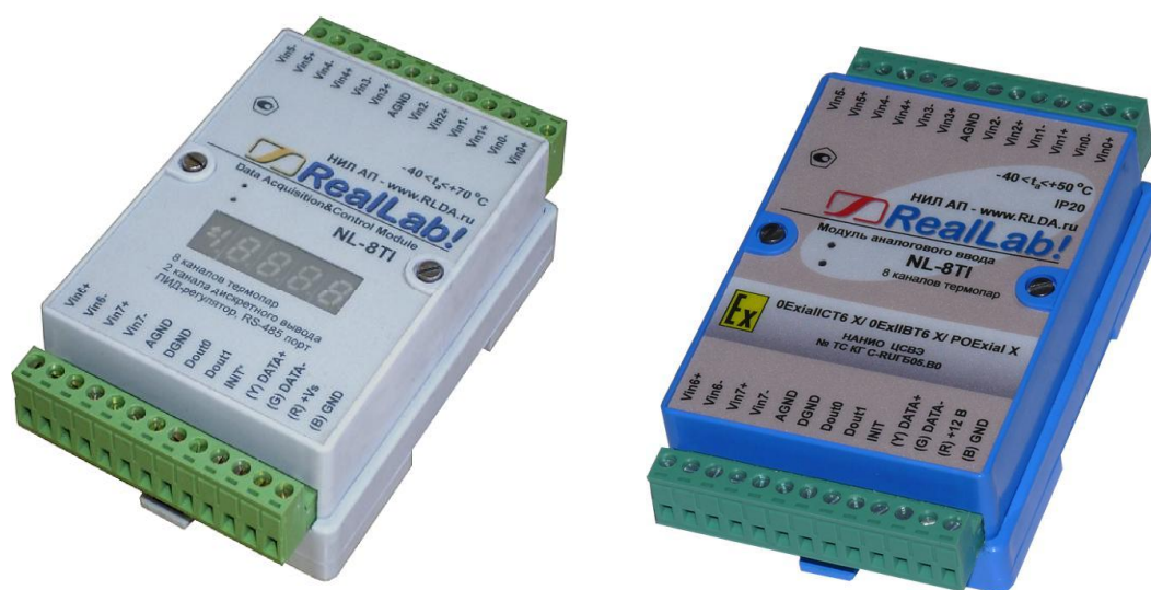
Рисунок 1 – Общий вид модулей модификаций NL-8AI, NL-8TI, NL-4RTD, NL-AO, NL-2C на примере NL-8TI-D, NL-8TI-Ex

Общий вид модулей представлен на рисунках 1 и 2. Схема расположения мест пломбирования представлена на рисунке 3.