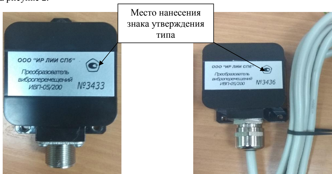
С коннектором для подключения внешнего соединительного кабеля

Маркировка типа выходного сигнала преобразователей виброперемещений ИВП представлена на рисунке 2.