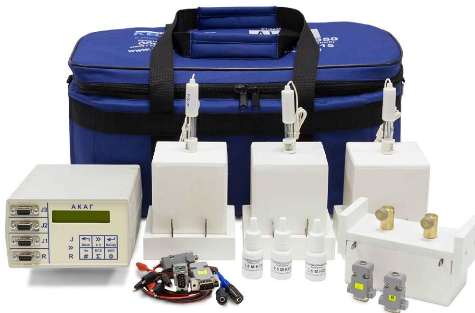
Рисунок 1 – Общий вид анализаторов

Общий вид анализаторов представлен на рисунке 1. Для защиты от несанкционированного доступа в анализаторе предусмотрена установка пломбы организации. Схема пломбирования анализаторов представлена на рисунке 2.