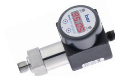
Рисунок 3 - Общий вид преобразователей давления DS, DM