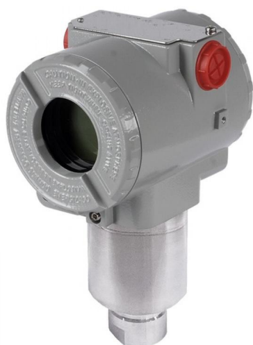
Рисунок 6 - Общий вид преобразователей давления HMP