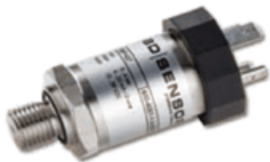
Рисунок 1 - Общий вид преобразователей давления DMP, DMK

Фотографии общего вида преобразователей представлены на рисунках 1 – 7.