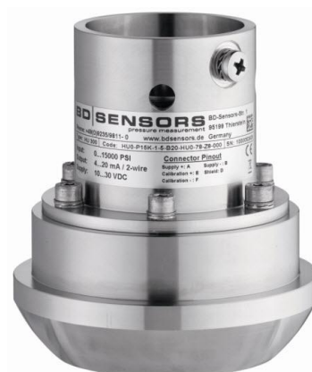
Рисунок 5 - Общий вид преобразователей давления HU