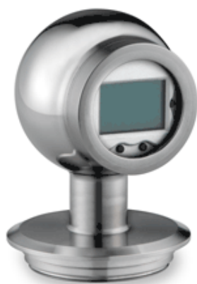
Рисунок 4 - Общий вид преобразователей давления XACT