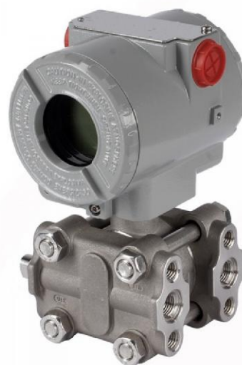
Рисунок 7 - Общий вид преобразователей давления DMD

Пломбировка преобразователей не осуществляется.