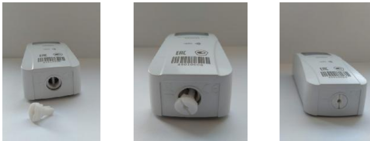
Рисунок 2 – Схема пломбировки распределителей SANEXT и SANEXT-R от несанкционированного доступа

Распределители пломбируются механической защелкой однократного применения, предназначенной для идентификации факта несанкционированного доступа. Демонтаж распределителя с отопительного прибора возможен только после разрушения пломбы, что фиксируется и кодируется в виде ошибки, которая выводится на дисплей. Схема пломбировки от несанкционированного доступа к распределителю представлена на рисунках 2 и 3.