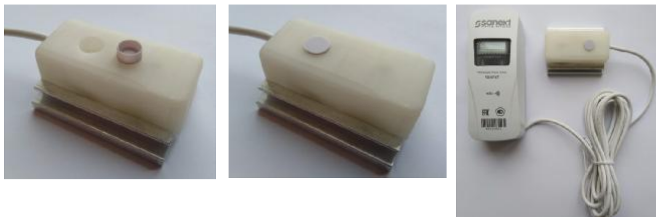
Рисунок 3 – Схема пломбировки распределителей SANEXT-R-V от несанкционированного доступа