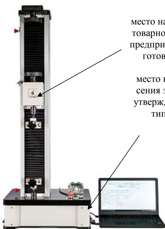
Рисунок 2 – Общий вид машин испытательных универсальных ТРМ-О Tochline

Внешний вид машин с указанием мест нанесения товарного знака и знака утверждения типа представлен на рисунках 2 - 5.