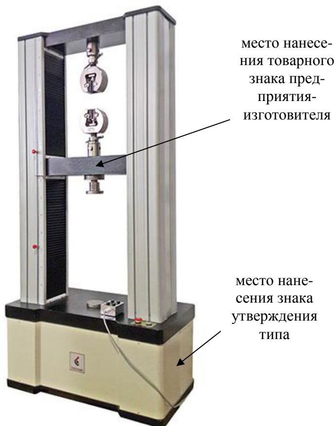
Рисунок 4 –Общий вид машин испытательных универсальных ТРМ-П Tochline