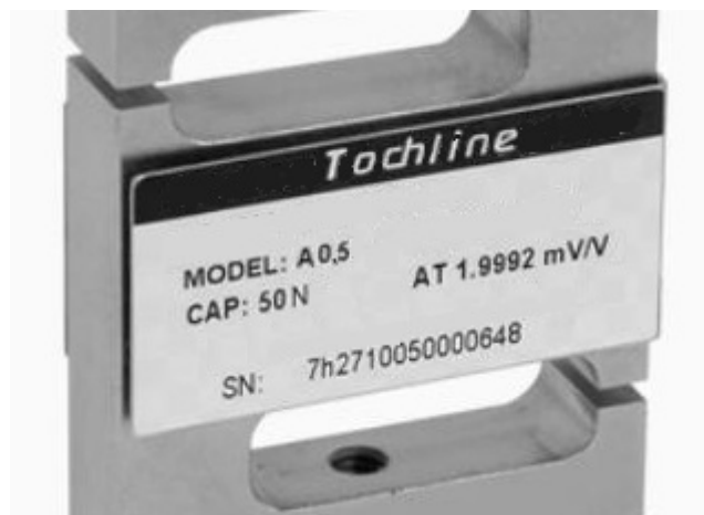
Рисунок 1 - Пример маркировки датчика силы

Машины могут комплектоваться несколькими сменными датчиками силы с различными диапазонами измерений, но не более наибольшего предела измерений силы машин. Наибольший предел измерений датчиков силы, входящих в комплект поставки, указан на заводской табличке датчиков. Пример маркировки датчика силы приведен на рисунке 1.