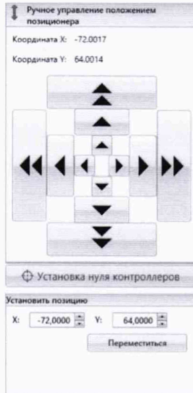
Рисунок 2 – Меню программы для ручного управления движением сканера

Перемещая антенну-зонд с установленным оптическим отражателем вдоль оси Ox в пределах рабочей зоны сканера с шагом \lambda_{min}/2 (где \lambda_{min} - минимальная длина волны, соответствующая верхней границе диапазона рабочих частот комплекса, до срабатывания механического ограничителя), фиксировать показания системы лазерной координатно-измерительной Leica AT401.