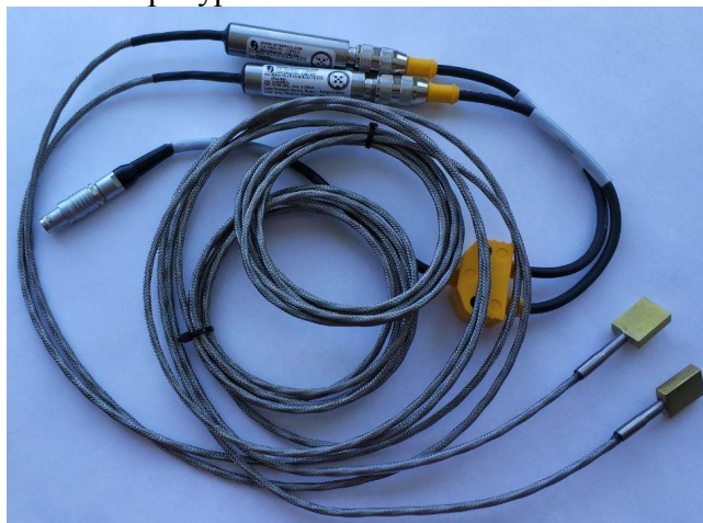
Рисунок 2 – Общий вид датчиков температуры Pt 1000 теплосчетчиков РТ900

Общий вид датчиков температуры Pt 1000 теплосчетчиков РТ900 приведен на рисунке 2.