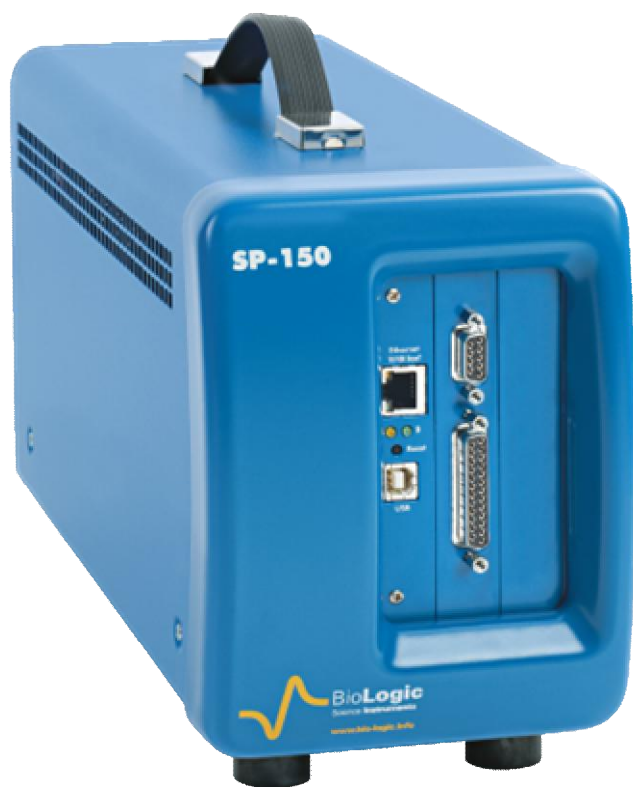
Рисунок 5 – Общий вид потенциостатов-гальваностатов SP-150