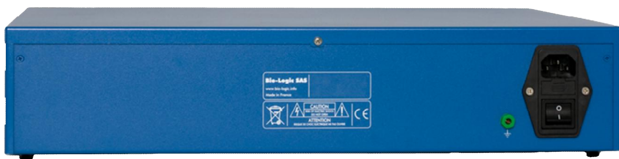
Рисунок 18 – Общий вид потенциостатов-гальваностатов VSP (вид сзади)