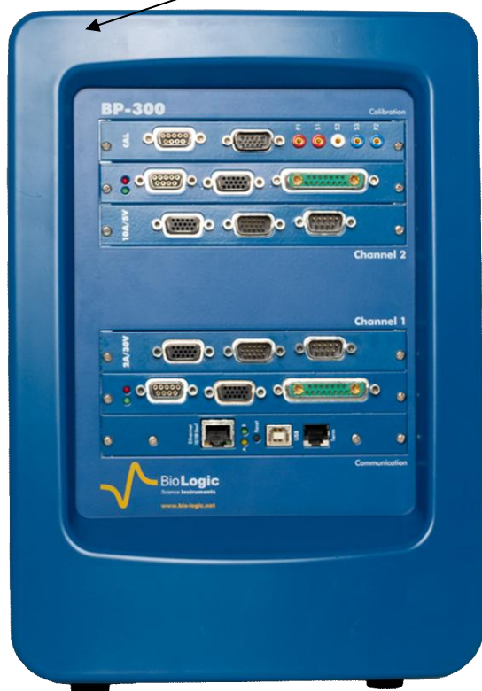
Рисунок 1 – Общий вид потенциостатов-гальваностатов BP-300