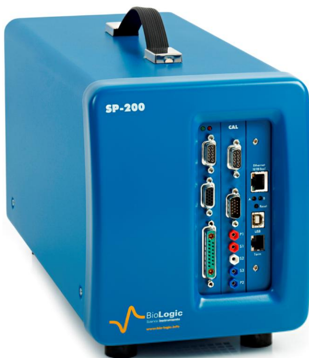
Рисунок 7 – Общий вид потенциостатов-гальваностатов SP-200