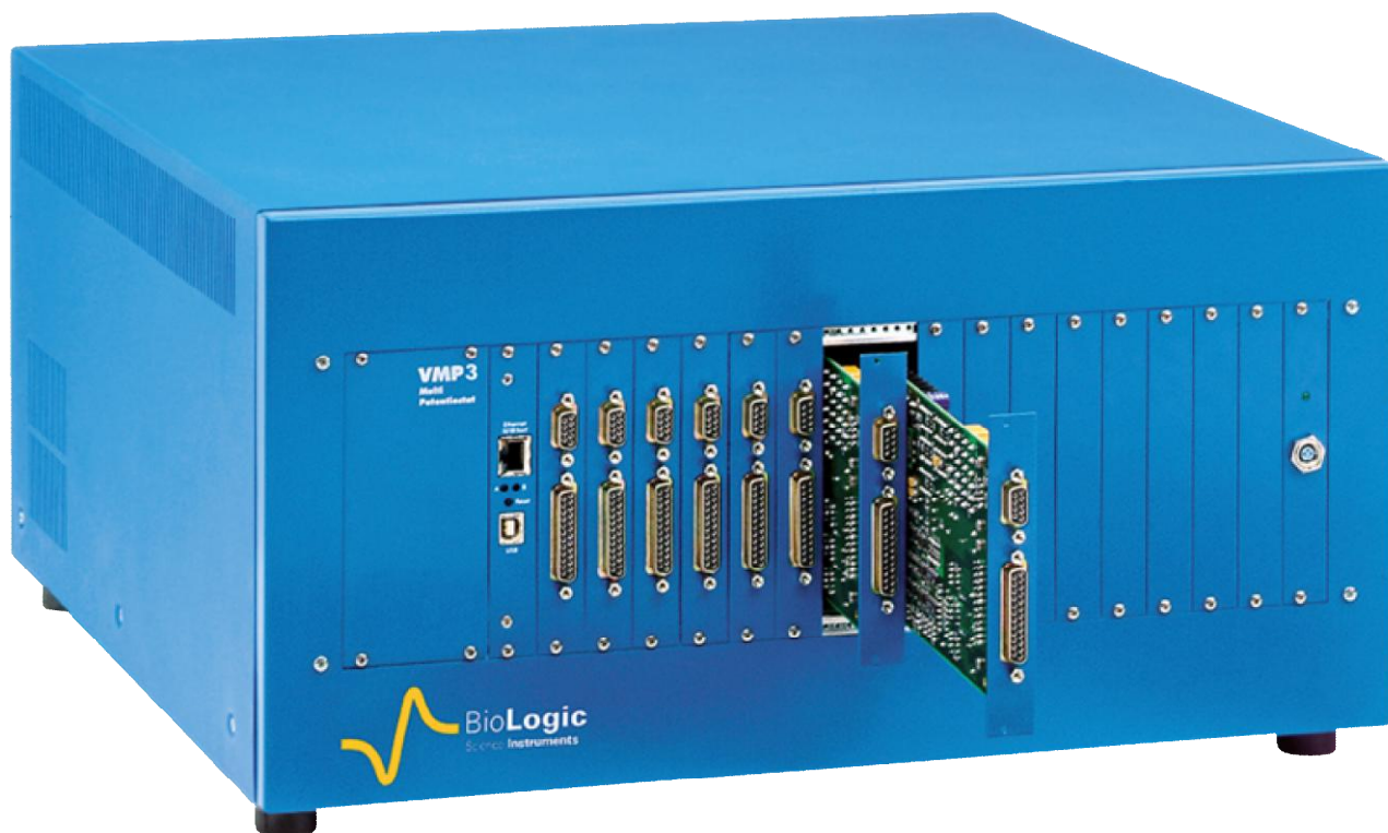
Рисунок 13 – Общий вид потенциостатов-гальваностатов VMP3