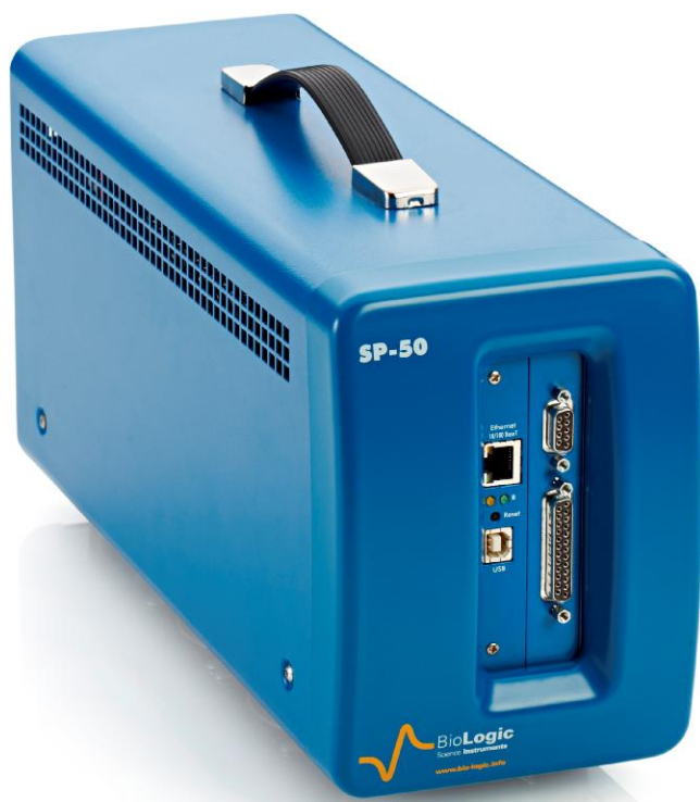
Рисунок 3 – Общий вид потенциостатов-гальваностатов SP-50