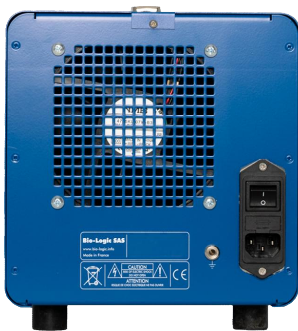
Рисунок 12 – Общий вид потенциостатов-гальваностатов SP-300 (вид сзади)