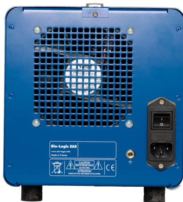
Рисунок 10 – Общий вид потенциостатов-гальваностатов SP-240 (вид сзади)