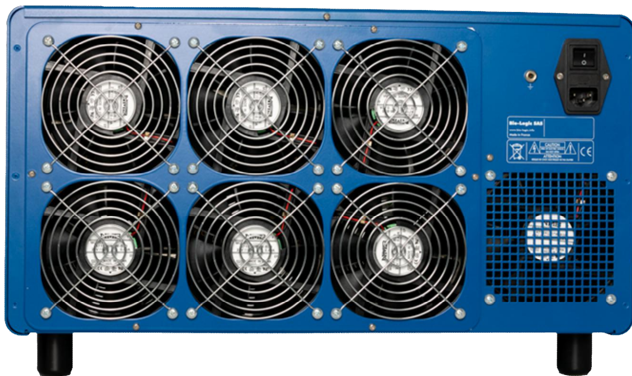
Рисунок 16 – Общий вид потенциостатов-гальваностатов VMP-300 (вид сзади)