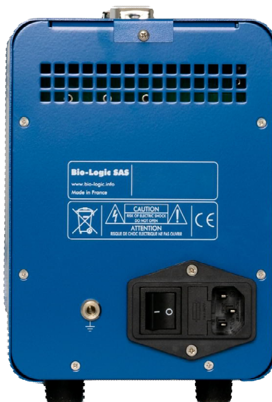
Рисунок 6 – Общий вид потенциостатов-гальваностатов SP-150 (вид сзади)