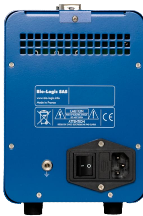
Рисунок 4 – Общий вид потенциостатов-гальваностатов SP-50 (вид сзади)