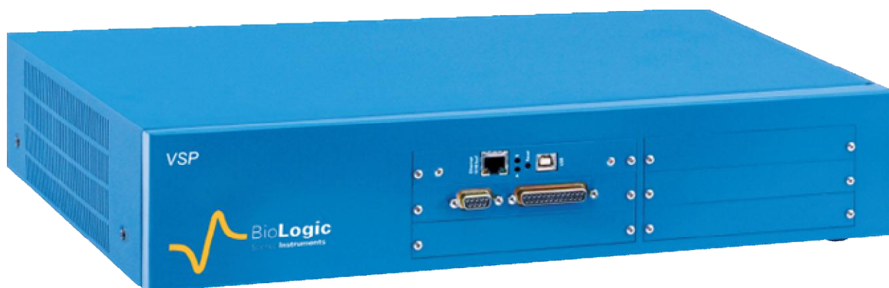
Рисунок 17 – Общий вид потенциостатов-гальваностатов VSP