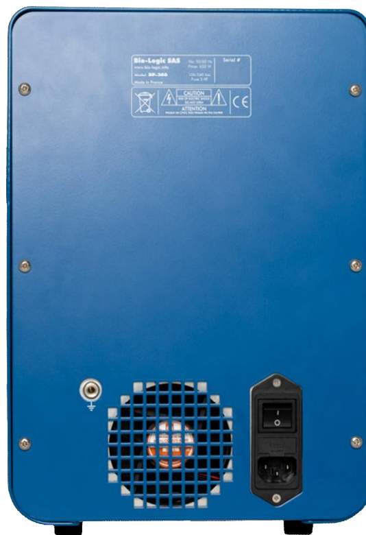
Рисунок 2 – Общий вид потенциостатов-гальваностатов BP-300 (вид сзади)