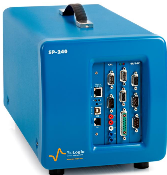
Рисунок 9 – Общий вид потенциостатов-гальваностатов SP-240