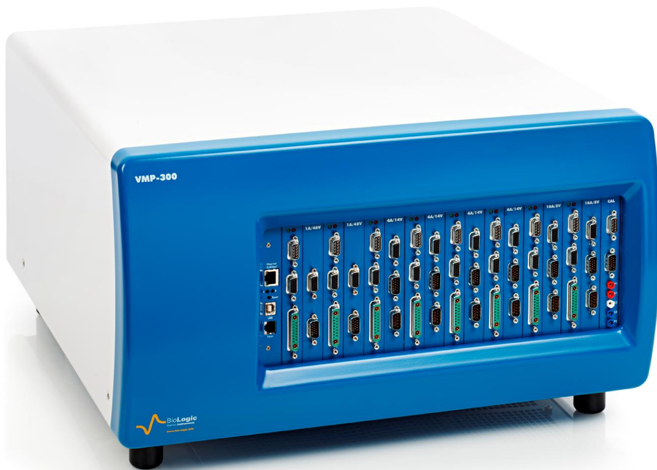
Рисунок 15 – Общий вид потенциостатов-гальваностатов VMP-300