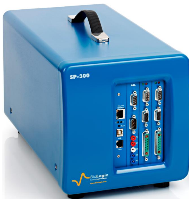
Рисунок 11 – Общий вид потенциостатов-гальваностатов SP-300