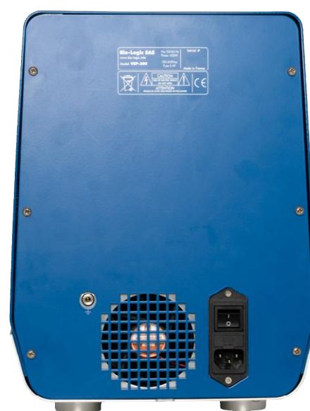
Рисунок 20 – Общий вид потенциостатов-гальваностатов VSP-300 (вид сзади)