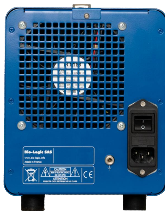
Рисунок 8 – Общий вид потенциостатов-гальваностатов SP-200 (вид сзади)