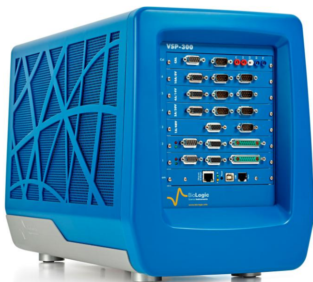
Рисунок 19 – Общий вид потенциостатов-гальваностатов VSP-300