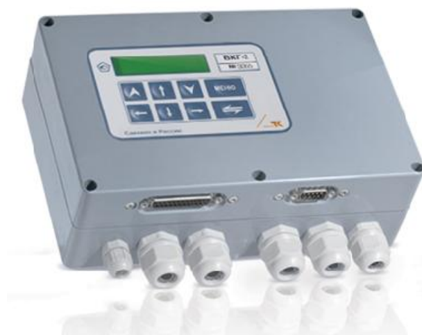
Рисунок 1 – Общий вид вычислителя

Общий вид вычислителя приведен на рисунке 1.