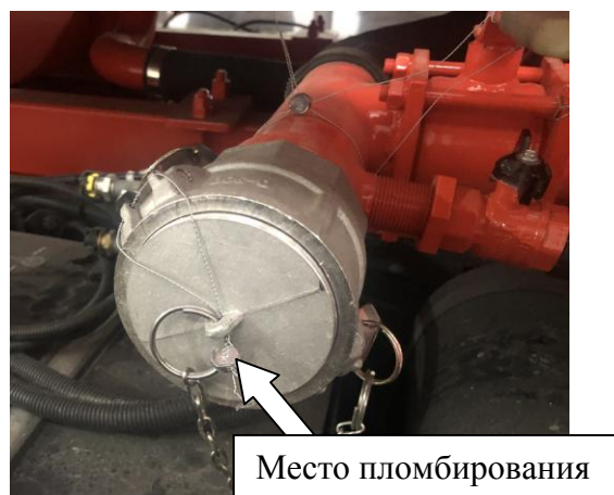
Рисунок 4 – Ручка открывания технологического отсека, заглушка БРС