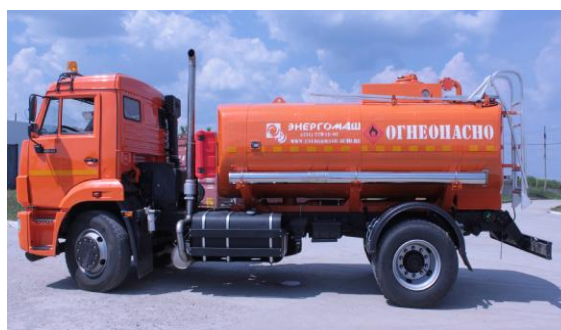
Рисунок 2 – Общий вид АЦ с одной секцией