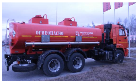
Рисунок 1 – Общий вид АТЗ с двумя секциями

Общий вид АТЗ и АЦ представлен на рисунке 1, 2. Место пломбирования от несанкционированного доступа обозначено на рисунке 3, 4, 5.