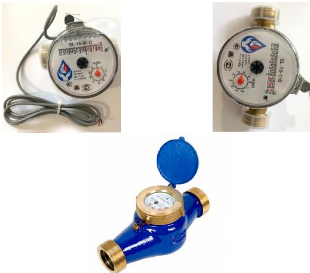
Рисунок 1 – Общий вид счетчиков