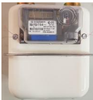
б) исполнения «ВЕКТОР Т» и «Вектор ТК»