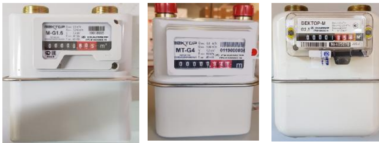
а) исполнения «ВЕКТОР М» и «ВЕКТОР МТ»

Пломбировку изготовителя или поставщика газа осуществляют с помощью проволоки и свинцовой (пластмассовой) пломбы.