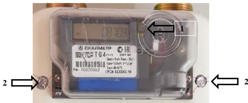
Рисунок 2 – Схема пломбировки от несанкционированного доступа, обозначения места нанесения знака поверки счетчиков газа диафрагменных ВЕКТОР исполнения «ВЕКТОР Т» и «Вектор ТК» (1 – место для установки знака поверки, 2– место для установки пломбы изготовителя или поставщика газа)