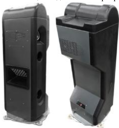
Рисунок 1 – Общий вид измерительных блоков типа БК1

Общий вид типовой маркировочной таблички приведён на рисунке 11.