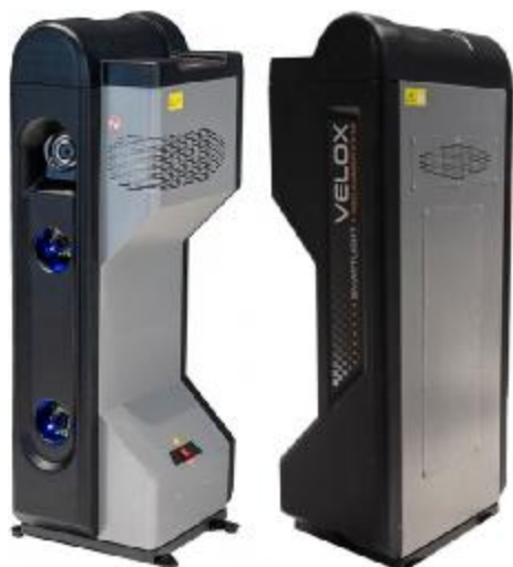
Рисунок 7 – Общий вид измерительных блоков типа БК7