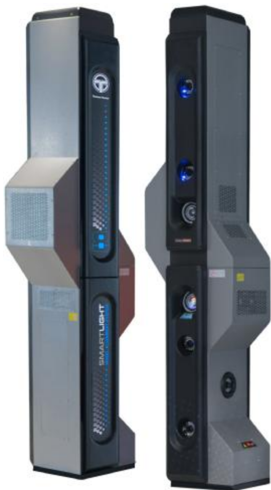
Рисунок 3 – Общий вид измерительных блоков типа БК3