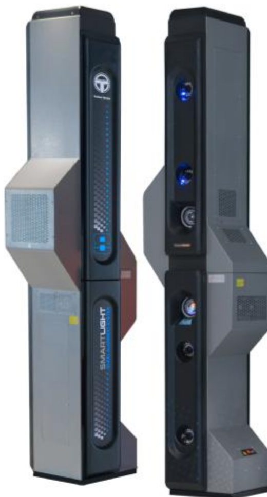
Рисунок 7 – Общий вид измерительных блоков БК9