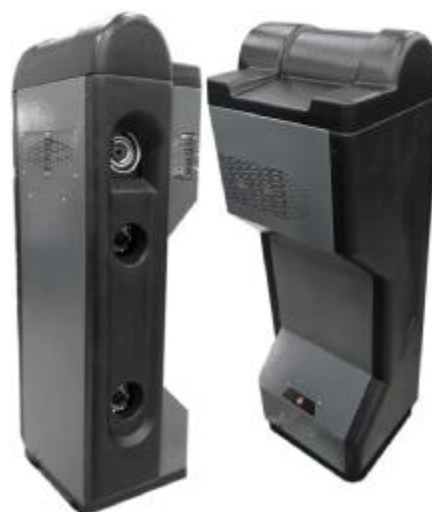
Рисунок 8 – Общий вид измерительных блоков типа БК8