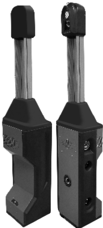
Рисунок 5 – Общий вид измерительных блоков типа БК5