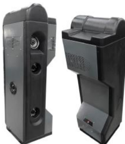
Рисунок 2 – Общий вид измерительных блоков типа БК2