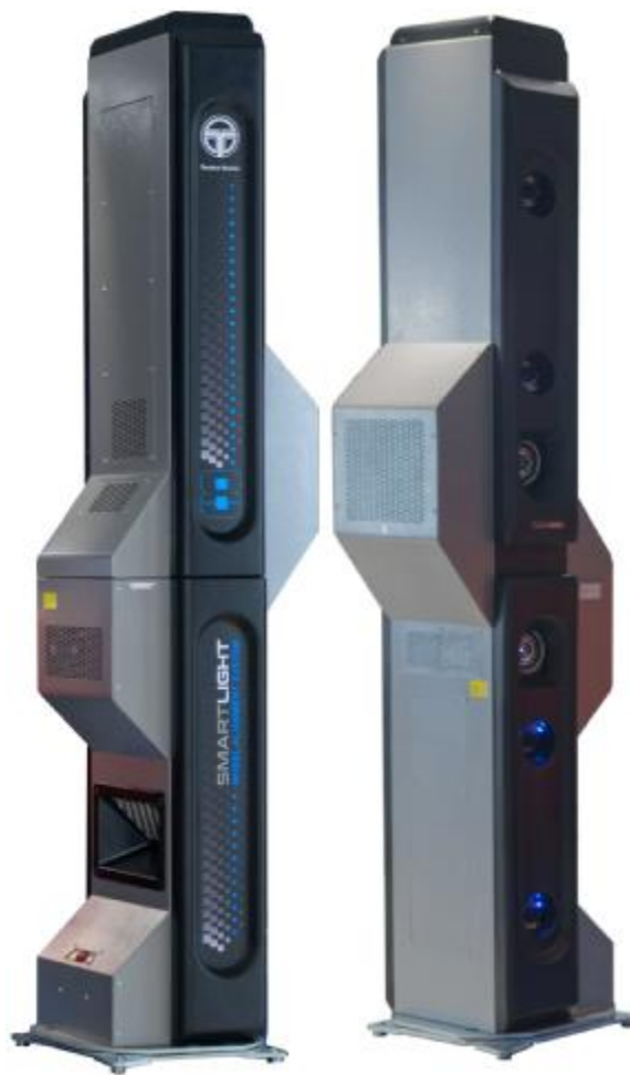
Рисунок 4 – Общий вид измерительных блоков типа БК4