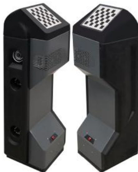
Рисунок 6 – Общий вид измерительных блоков типа БК6