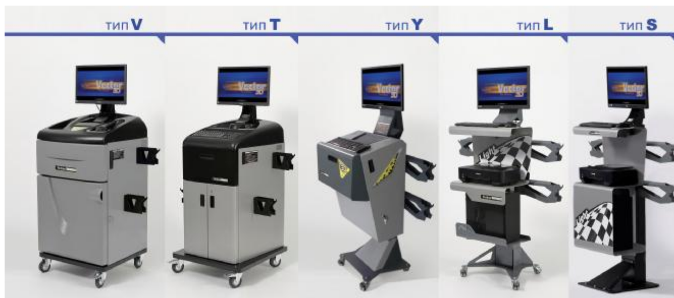
Рисунок 10 - Общий вид приборных стоек