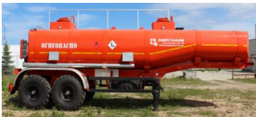
Рисунок 1 – Общий вид ППЦ

Общий вид ППЦ представлен на рисунке 1. Место пломбирования от несанкционированного доступа обозначено на рисунке 2 и 3.