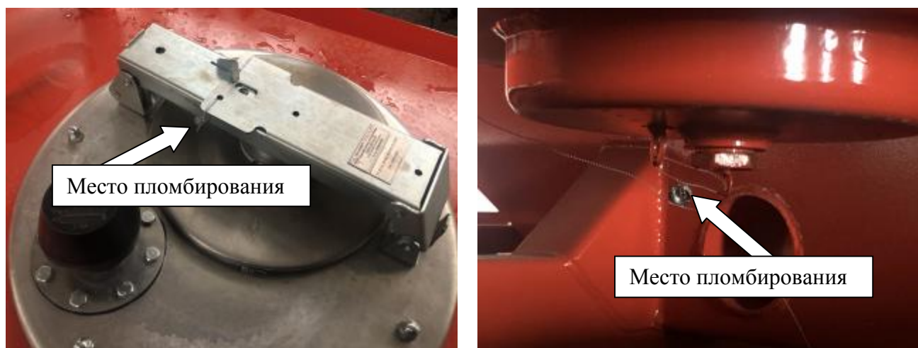
Рисунок 2 – Запорный механизм крышки заливной горловины и кран сливной отстойника