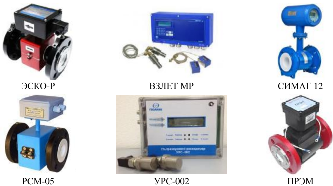
Рисунок 4.1 – Общий вид ПРИ