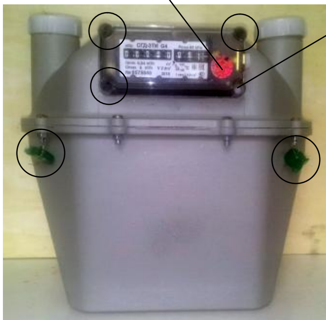
Рисунок 2 – Схема опломбирования счетчика, обозначение мест нанесения знака поверки

Место нанесения знака поверки в виде оттиска клейма