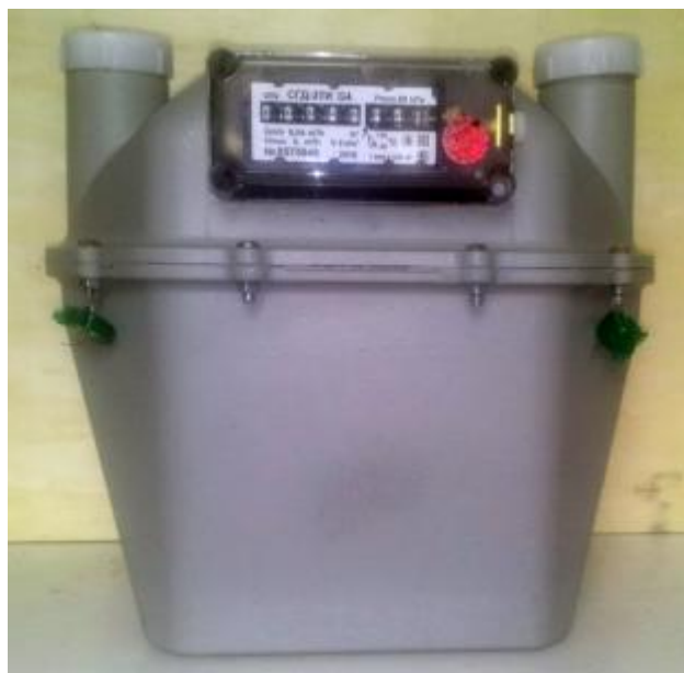
б) Общий вид счетчиков газа СГД-3Т-хИ-х-Gx