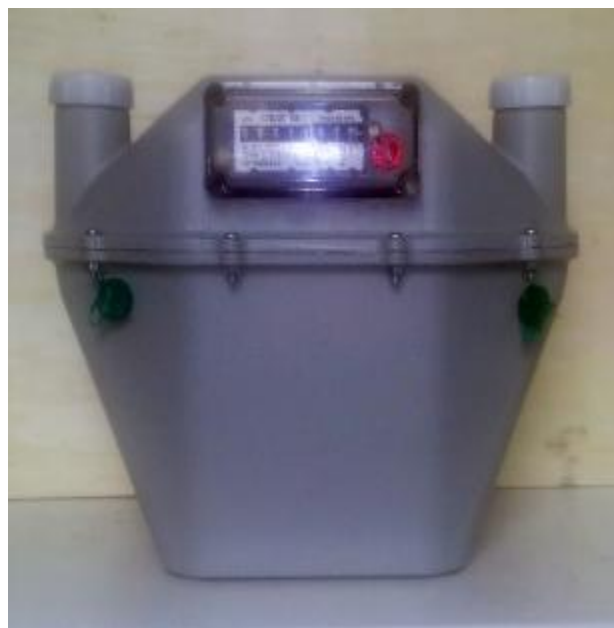
а) Общий вид счетчиков газа СГД-3Т-х-х-Gx

Общий вид счетчиков представлен на рисунке 1.