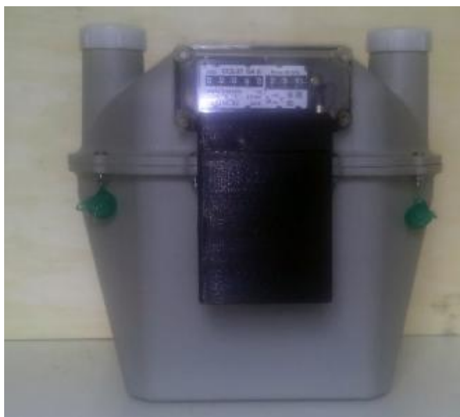
в) Общий вид счетчиков газа СГД-3Т-хR-х-Gx

Рисунок 1 – Общий вид счетчиков газа диафрагменных с термокомпенсатором СГД-3Т