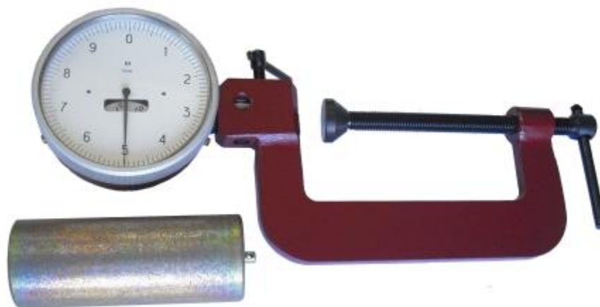
Рисунок 1 - Общий вид прогибомера ПМ