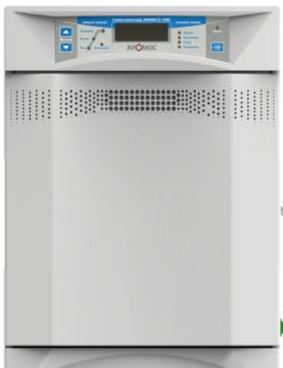
Рисунок 1 – Общий вид хроматографа газового «Хромос GX-1000.1»