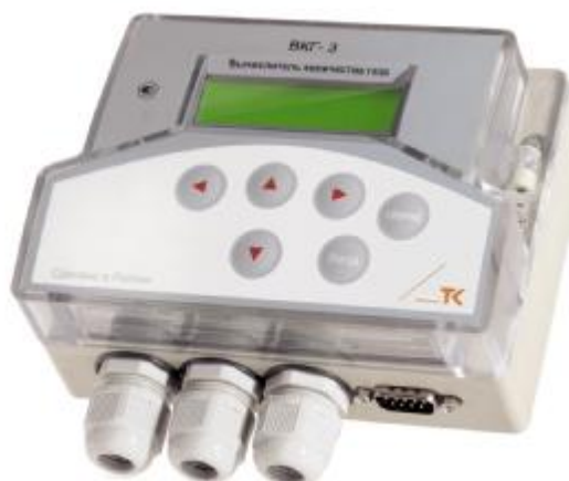
Рисунок 1 –Общий вид вычислителя

В целях предотвращения несанкционированного доступа к узлам регулировки и настройки и ПО, а также к элементам конструкции, предусмотрены места пломбирования, указанные на рисунке 2.