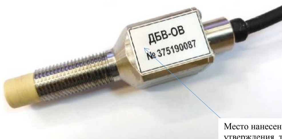
Рисунок 1 – Общий вид датчиков биения вала серии ДБВ с выносным преобразователем и маркировочной табличкой