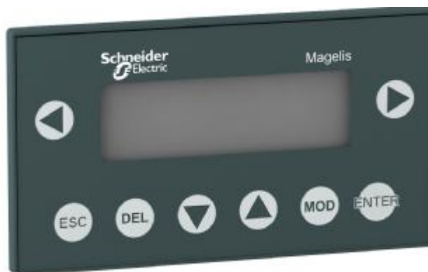
Рисунок 2 - Внешний вид цифрового дисплея.

Внешний вид цифрового дисплея представлен на рисунке 2.