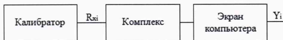
Рисунок 4 - Схема подключений при определении погрешностей ИК, реализующих аналого-цифровое преобразование сигналов от термопреобразователей сопротивления.

где X_n - нормирующее значение, соответствующее диапазону преобразования.