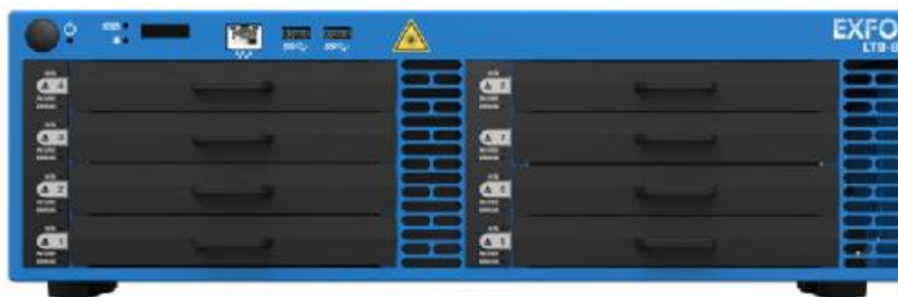
Рисунок 3 – Общий вид системы LTB-8