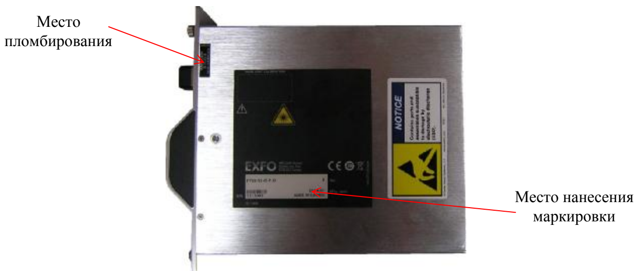
Рисунок 6 – Схема пломбировки сменных модулей систем от несанкционированного доступа, обозначение места маркировки