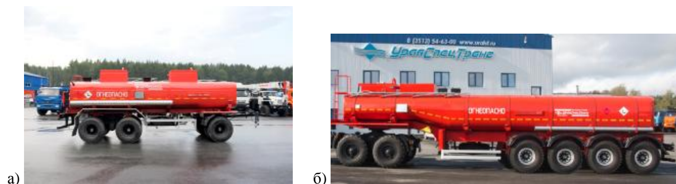
Рисунок 2 – Общий вид а) ПЦ с двумя секциями, б) ППЦ с двумя секциями