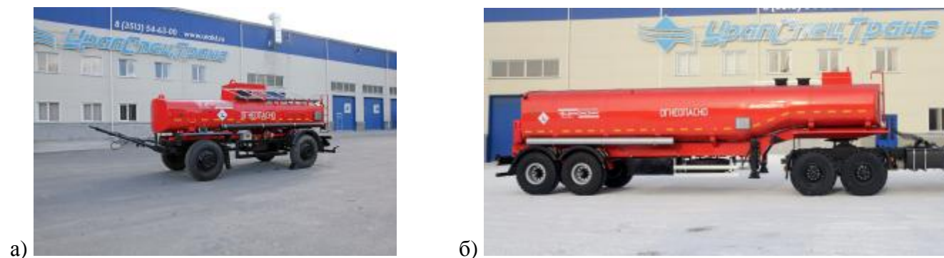
Рисунок 1 – Общий вид а) ПЦ с одной секцией, б) ППЦ с одной секцией

Схема пломбировки от несанкционированного доступа представлена на рисунках 4, 5.