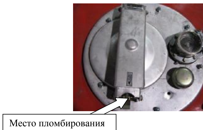
Рисунок 4 – Запорный механизм крышки заливной горловины ПЦ и ППЦ