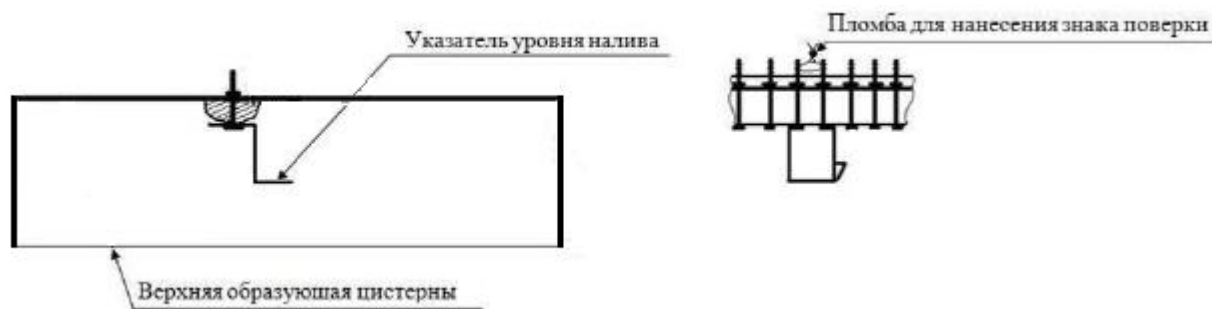
Рисунок 6 – Схема пломбировки от несанкционированного изменения положения указателя уровня налива, обозначение места нанесения знака поверки

Схема пломбировки предотвращающая доступ к узлам регулировки представлена на рисунке 6. Пломбы устанавливаются организацией, осуществляющей поверку, с нанесением знака поверки.