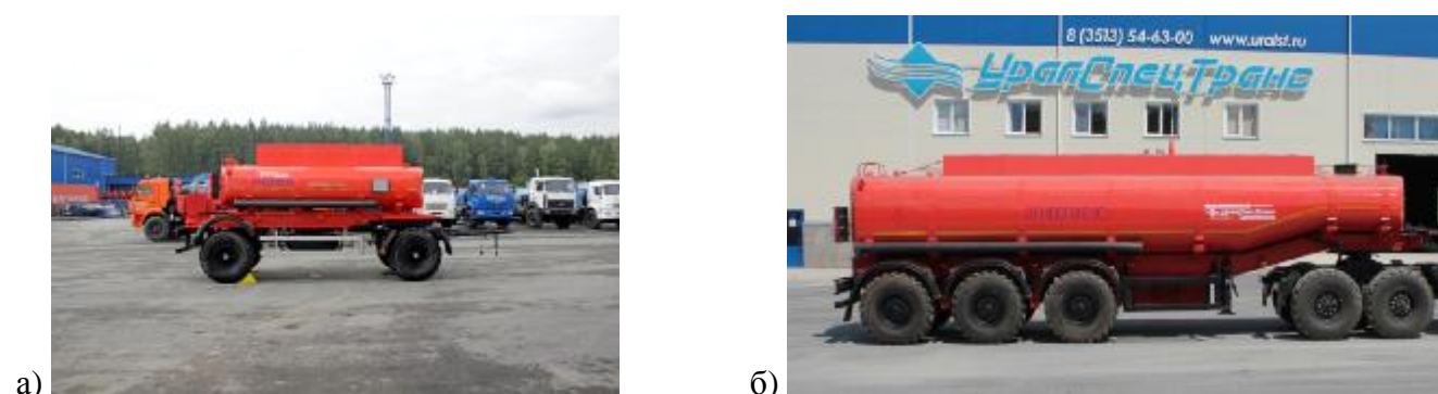
Рисунок 3 – Общий вид а) ПЦ с вариантами исполнения от одной до десяти секций, б) ППЦ с вариантами исполнения от одной до десяти секций