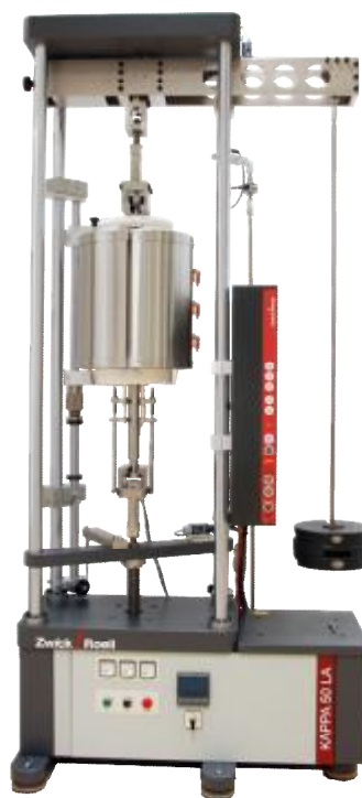
Рисунок 2 – Общий вид машин Карра 50 LA, Карра 100 LA (исполнение с нагружающим устройством рычажного типа с приложением нагрузки посредством грузов)