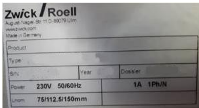
Рисунок 11 – Общий вид типовой маркировки (заводской таблички) датчика деформации ZwickRoell