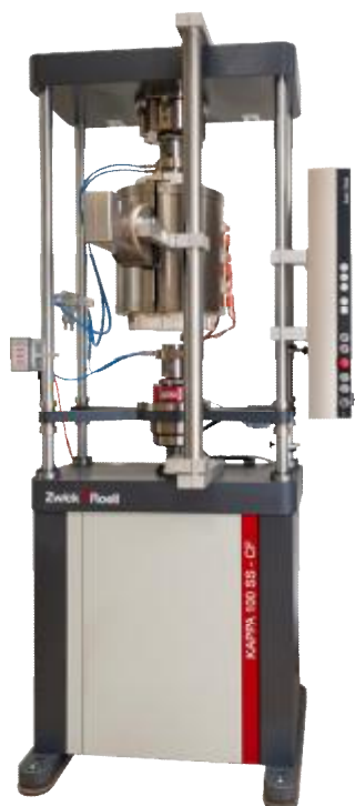
Рисунок 4 – Общий вид машин Карра 1 SS-CF, Карра 10 SS-CF, Карра 50 SS-CF, Карра 100 SS-CF