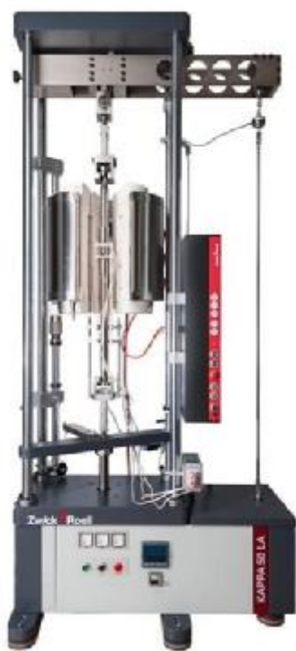
Рисунок 1 – Общий вид машин Карра 50 LA, Карра 100 LA (исполнение с нагружающим устройством рычажного типа с пружиной)

Общий вид машин приведён на рисунках 1 – 6. Общий вид типовой маркировки (заводской таблички) машин приведён на рисунке 7. Общий вид типовой маркировки (заводской таблички) датчика силы приведён на рисунке 8. Общий вид типовой маркировки (заводской таблички) датчиков деформации приведён на рисунке 10-12.