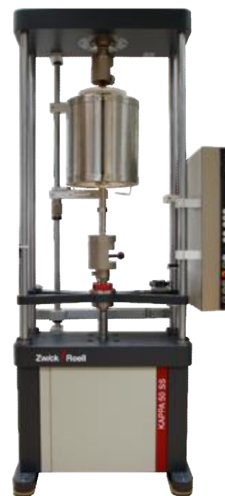
Рисунок 3 – Общий вид машин Карра 1 SS, Карра 10 SS, Карра 50 SS, Карра 100 SS