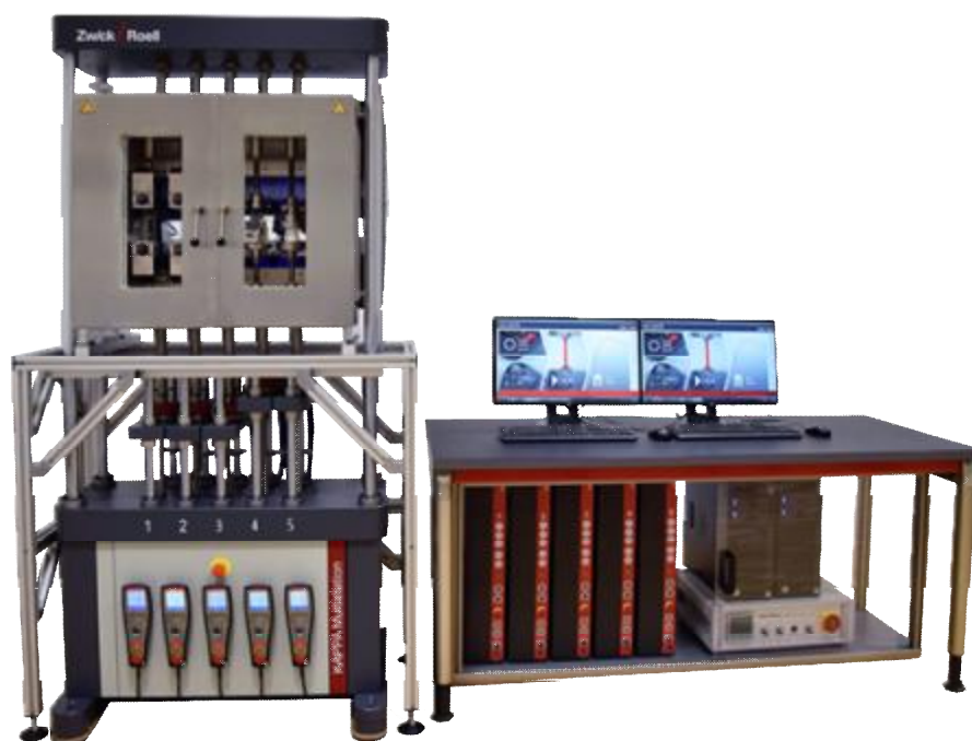
Рисунок 6 – Общий вид машин Карра с несколькими подвижными траверсами (от 2 до 6)