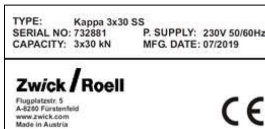
Рисунок 7 – Общий вид типовой маркировки (заводской таблички) машин