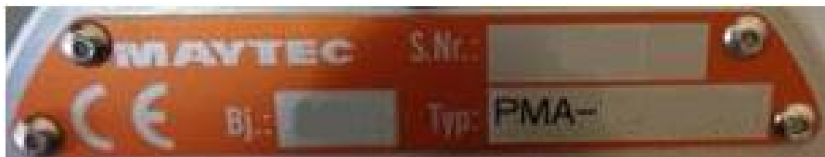
Рисунок 12 – Общий вид типовой маркировки (заводской таблички) датчика деформации серий PMA

Для ограничения доступа в целях несанкционированной настройки и вмешательства производится пломбирование мест посадки рычага посредством нанесения специальной краски и нанесения защитной наклейки на измерительные узлы.