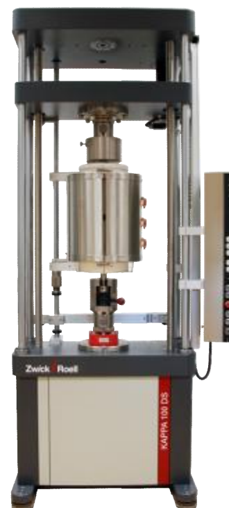
Рисунок 5 – Общий вид машин Карра 5 DS, Карра 10 DS, Карра 20 DS, Карра 50 DS, Карра 100 DS, Карра 150 DS, Карра 200 DS, Карра 250 DS, Карра 300 DS, Карра 400 DS, Карра 600 DS, Карра 800 DS