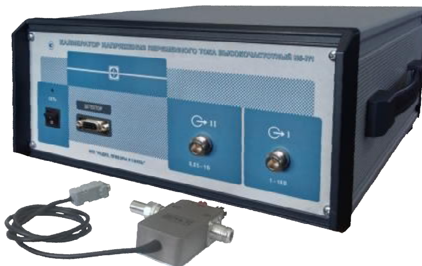
Рисунок 1 – Общий вид калибратора напряжения переменного тока Н5-7/1

Схема пломбировки от несанкционированного доступа, обозначение мест нанесения знака поверки представлены на рисунке 2.