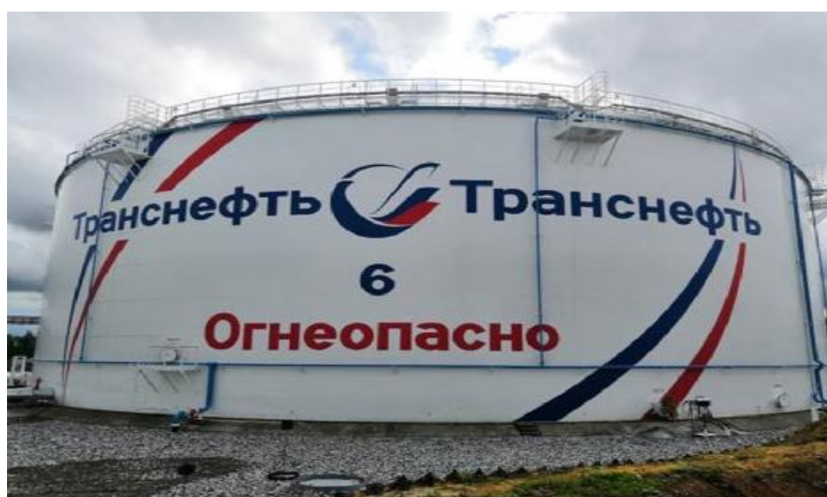
Рисунок 2 – Общий вид резервуара РВСП-50000 зав.№ 6