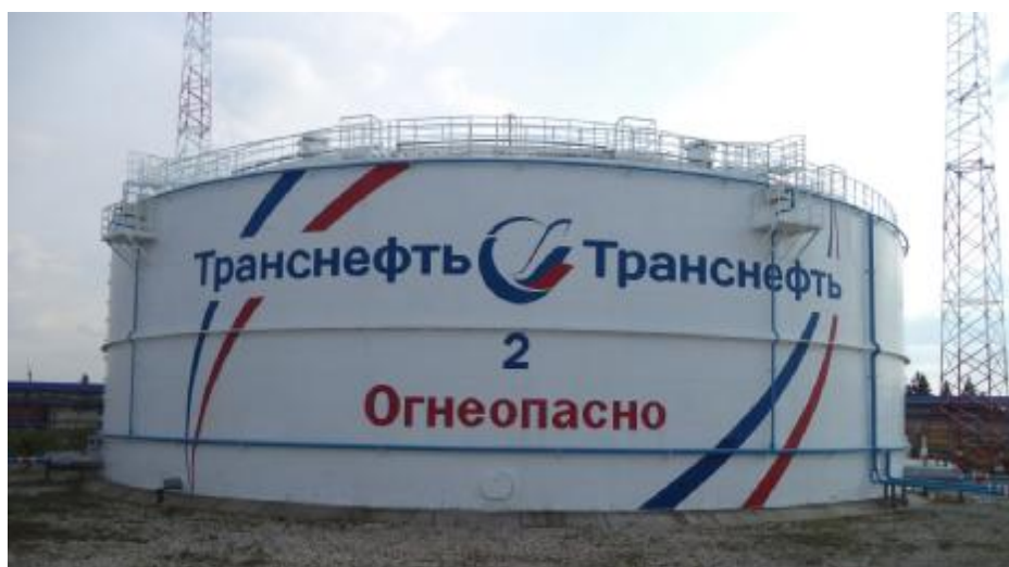
Рисунок 1 – Общий вид резервуара РВС-20000 зав.№ 2