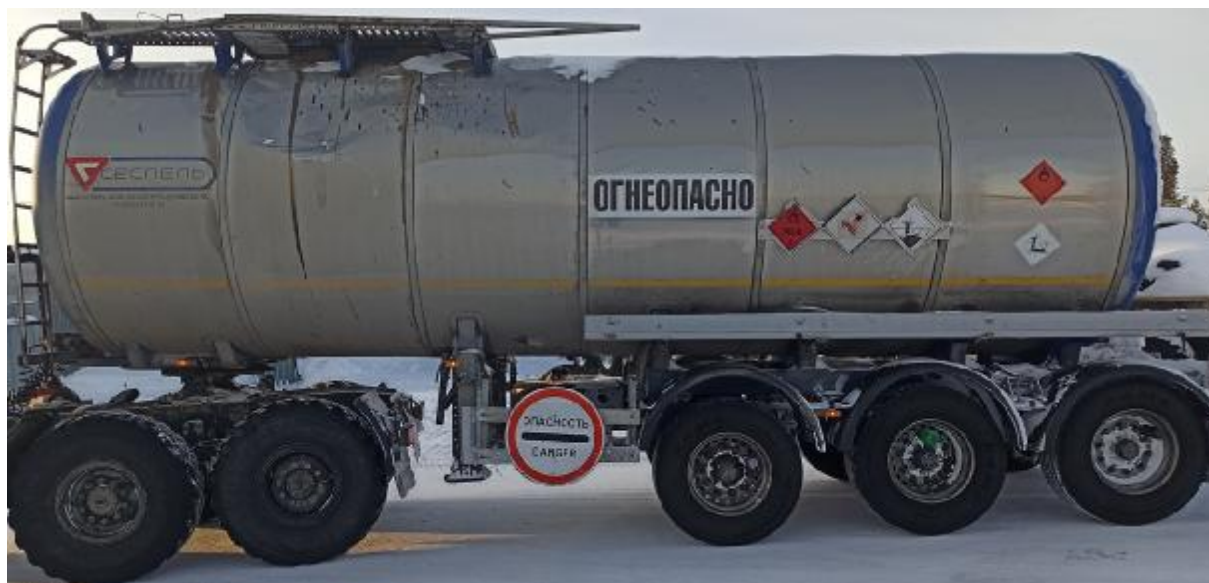
Рисунок 4 – Общий вид ППЦ 964872