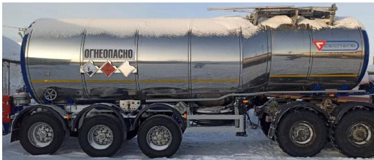
Рисунок 7 – Общий вид ППЦ SF3B28

Схема пломбировки от несанкционированного изменения положения указателя уровня налива, обозначение места нанесения знака поверки представлены на рисунке 8.