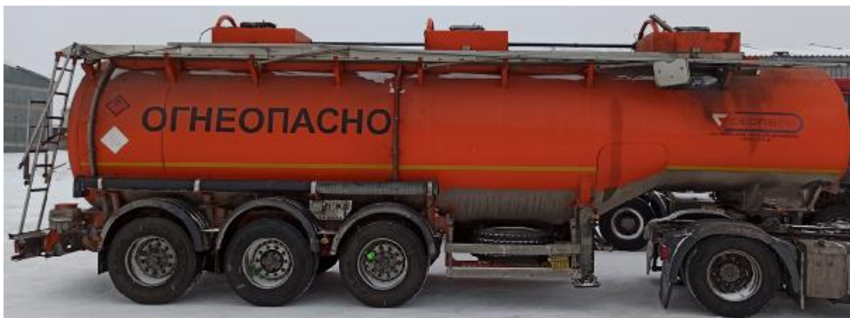
Рисунок 2 – Общий вид ППЦ 964846