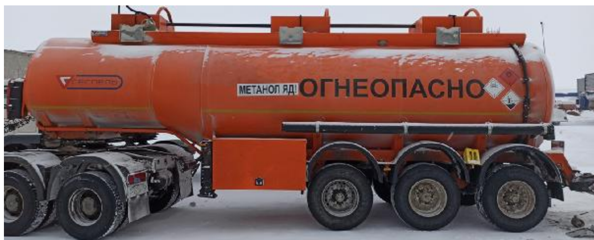
Рисунок 6 – Общий вид ППЦ SF3328