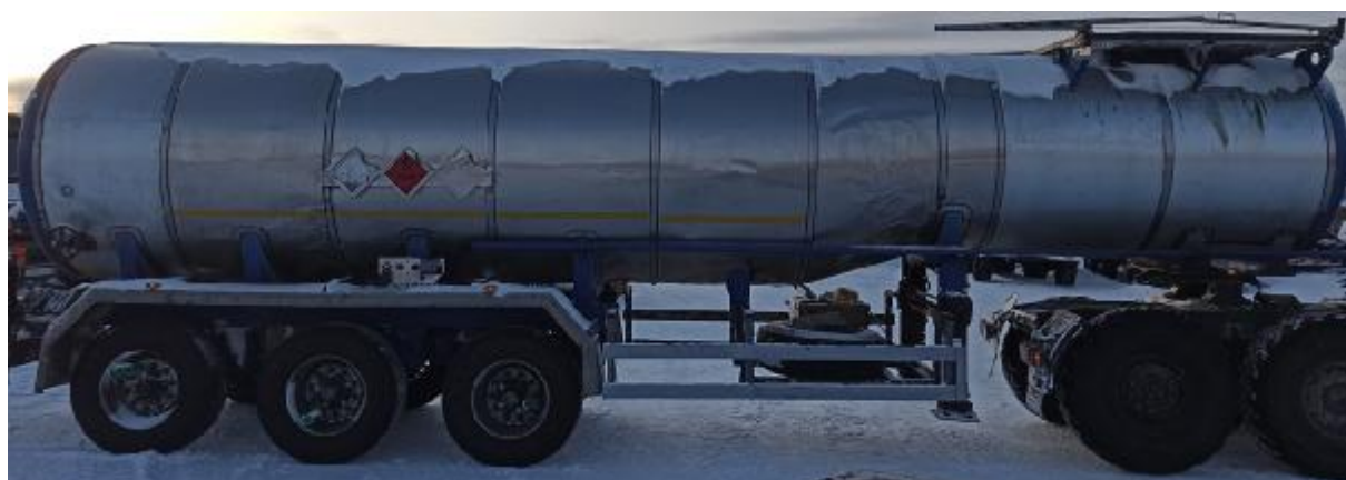
Рисунок 5 – Общий вид ППЦ 964879