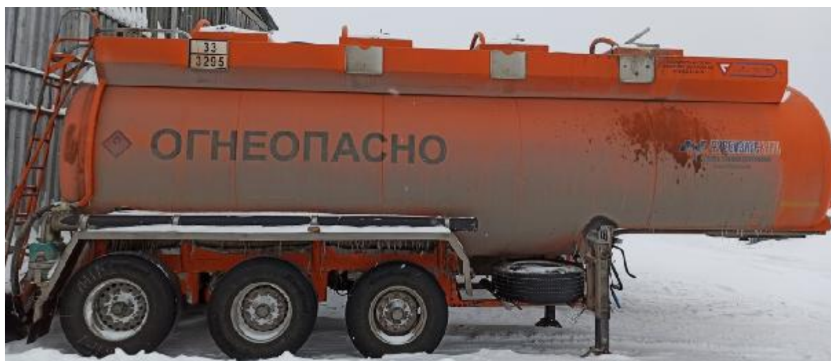
Рисунок 1 – Общий вид ППЦ 964845

Общий вид ППЦ представлен на рисунках 1-7.