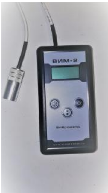
Рисунок 1 – Общий вид виброметров ВИМ-2

Общий вид виброметров, место пломбировки от несанкционированного доступа и место нанесения знака утверждения типа приведены на рисунках 1 и 2.