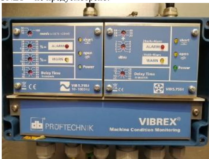
Рисунок 1 - Общий вид аппаратуры вибродиагностики и мониторинга модели VIBREX ®

Пломбирование аппаратуры вибродиагностики и мониторинга моделей VIBREX ® , VIBGUARD ® и VIBRONET ® не предусмотрено.