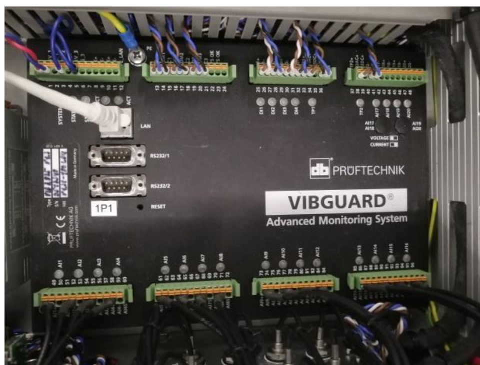
Рисунок 2 - Общий вид аппаратуры вибродиагностики и мониторинга модели VIBGUARD ®