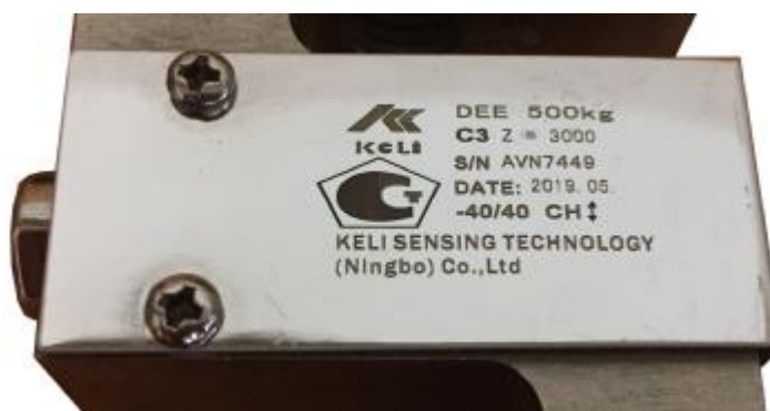
Рисунок 3 — маркировочная табличка средства измерений (пример)

Пример маркировочной таблички показан на рисунке 3.