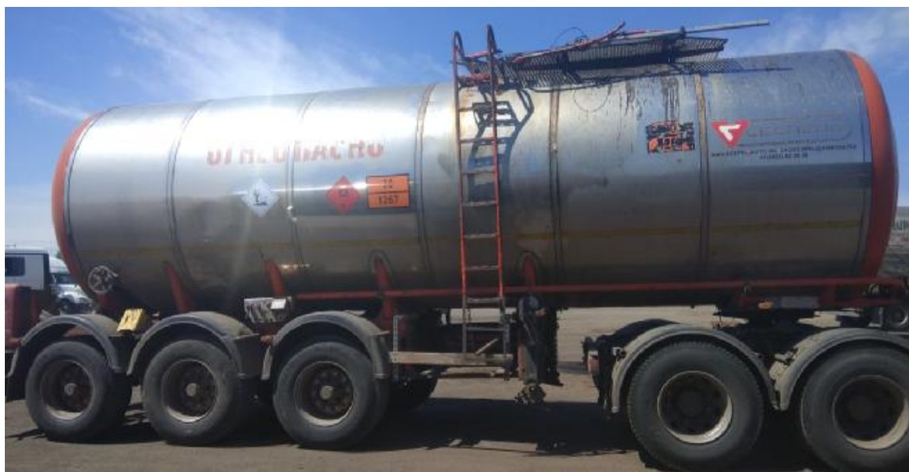
Рисунок 1 - Общий вид полуприцепа-цистерны 964872