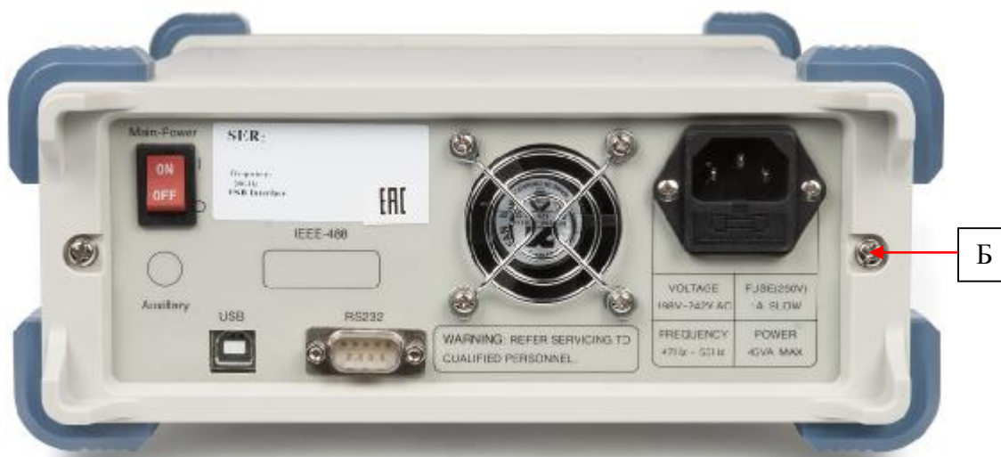
Рисунок 2 – Схема пломбировки от несанкционированного доступа (Б)