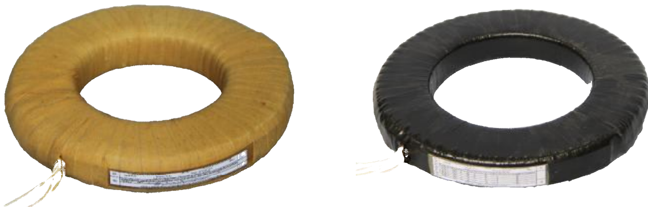
Рисунок 2 – Общий вид трансформаторов тока встроенных ТВ-ЗТМ категории размещения – 1