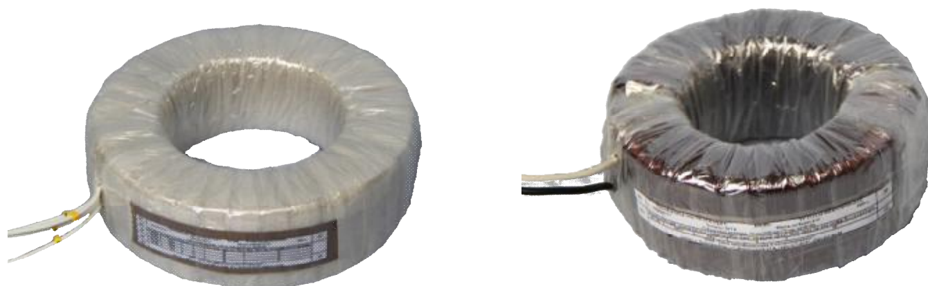
Рисунок 1 – Общий вид трансформаторов тока встроенных ТВ-ЗТМ категории размещения – 2

Пломбирование трансформаторов тока встроенных ТВ-ЗТМ не предусмотрено. По заявке Заказчика трансформаторы литого исполнения могут иметь защиту от несанкционированного доступа к вторичным цепям обмоток с возможностью опломбирования. Схема пломбировки от несанкционированного доступа представлена на рисунке 3.