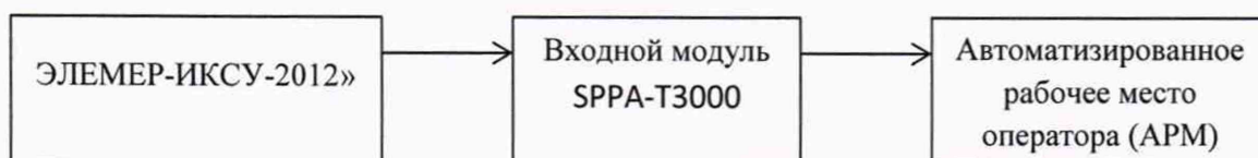
Рисунок 2 - Общая схема проведения эксперимента при поверке ИК

Схема проведения эксперимента представлена на рисунке 2.