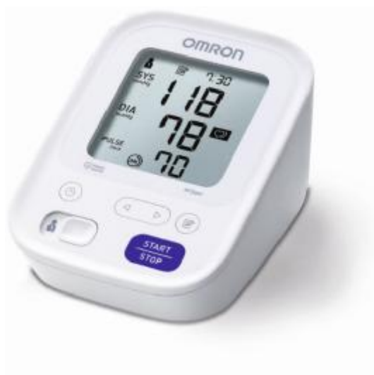
Рисунок 3 – Общий вид OMRON M3 Expert (ALRU)