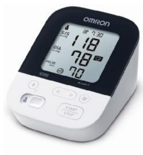
Рисунок 2 – Общий вид OMRON M4 Intelli IT (ALRU)