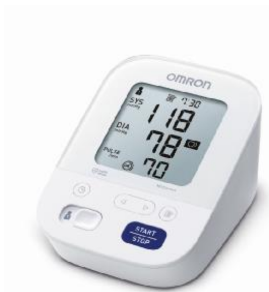
Рисунок 1 – Общий вид OMRON M3 Comfort (ALRU)