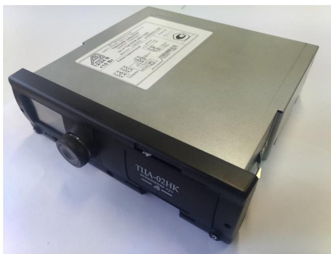
Рисунок 1 – Общий вид тахографа

Схема пломбировки от несанкционированного доступа с указанием места нанесения знака утверждения типа приведена на рисунке 2.