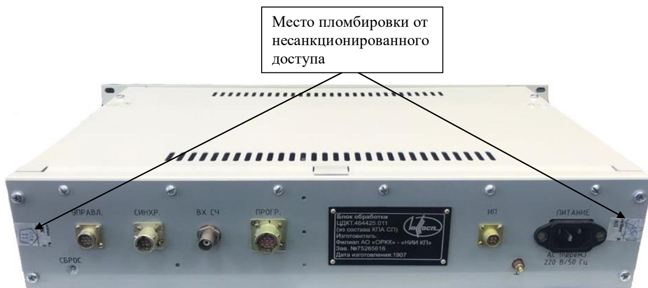
Рисунок 3 – Общий вид задней панели КПА СП