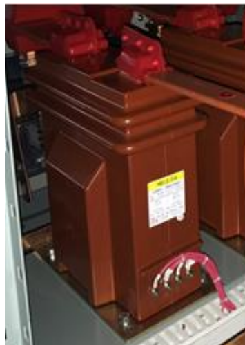
Рисунок 1 – Общий вид трансформаторов тока 2WS-287R