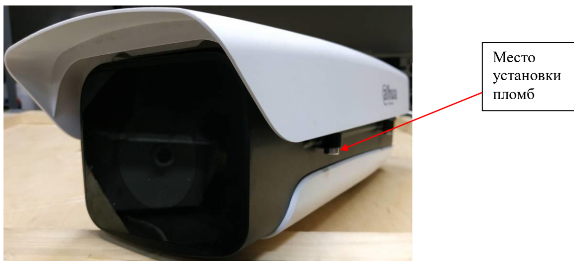
Рисунок 2 - Общий вид распознающей видеокамеры комплексов и место установки пломб