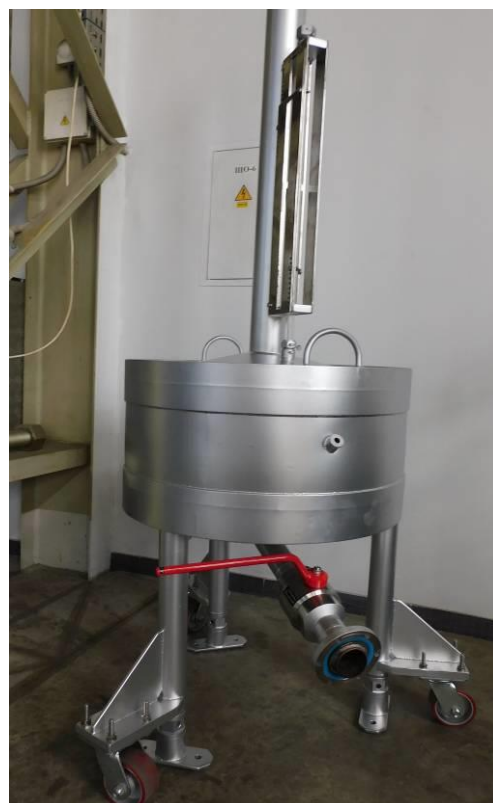
Рисунок 2 - Общий вид мерников

Схема пломбирования мерников от несанкционированного доступа приведена на рисунках 3-4.