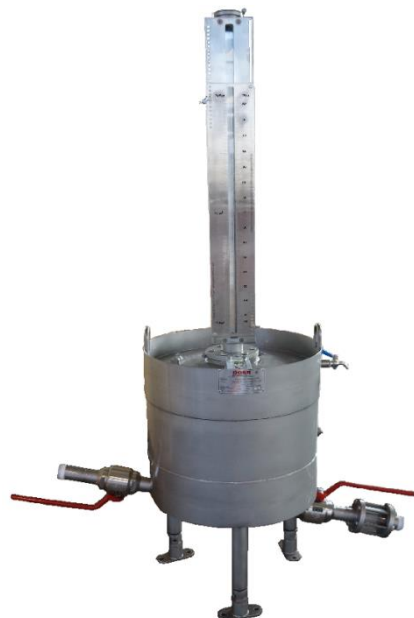
Рисунок 1 - Общий вид мерников