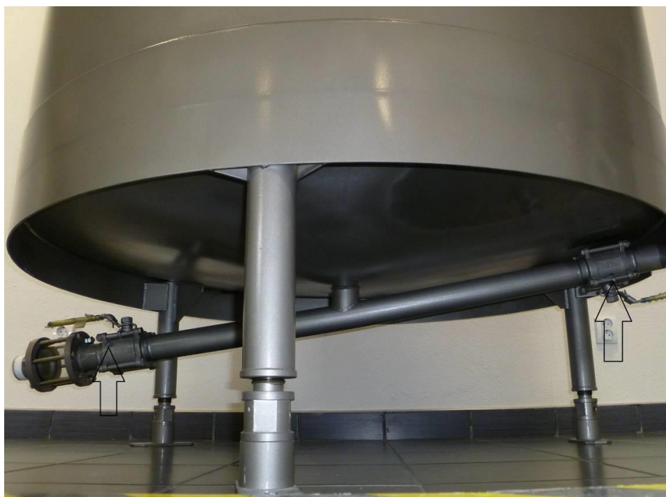
Рисунок 4 - Места пломбировки от несанкционированного доступа

Пломбировке подлежат следующие элементы конструкции: