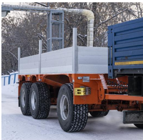
КТС – 3

Общий вид средства измерений представлен на рисунке 1. Схема пломбировки от несанкционированного доступа представлена на рисунке 2.