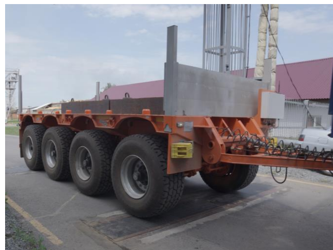
КТС – 4